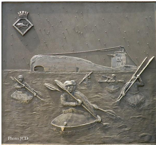
Kayaks et HMS Tuna (Mémorial, Le Verdon)

Sous l'autorité du Premier ministre, Winston CHURCHILL, Lord Louis MOUNTBATTEN est nommé commandant en chef des opérations combinées ( COHQ, Combined Operations Headquarters ). Le major HASLER est affecté au centre de développement des opérations combinées ( CODC ). Ce dernier va se battre pour faire triompher son projet : envoyer des commandos se déplaçant à bord de kayaks. Mission : détruire les navires forceurs de blocus dans le port de Bordeaux. Les kayaks remonteront la Gironde puis la Garonne après avoir été débarqués au large de Montalivet.