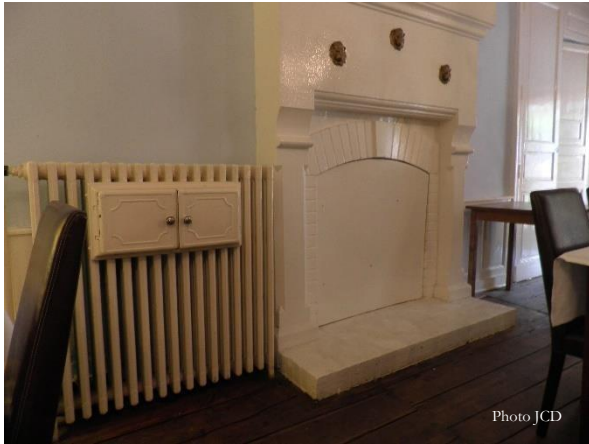
La Toque Blanche (juin 2012)

Ils atteignent Ruffec le 18 décembre, où ils se présentent à l'hôtel-restaurant « La Toque Blanche » pour y manger une soupe (seul plat pouvant être servi sans ticket de rationnement). C'est