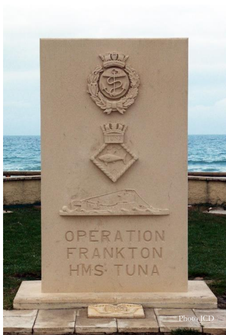
Monument de Montalivet

Le HMS TUNA quitte le port de Greenock le 30 novembre à 10 heures 30. C'est seulement en mer que les hommes du commando découvrent la mission : il ne s'agit pas d'attaquer le Tirpitz, comme ils le croyaient ! Après un arrêt pour exercice de mise à l'eau des kayaks (le canon est équipé pour servir de grue), le voyage se poursuit. Les occupations à bord sont nombreuses : apprendre des mots de français, mémoriser les détails de la mission, maîtriser l'armement et les équipements. Place aussi à la détente en fêtant un anniversaire.