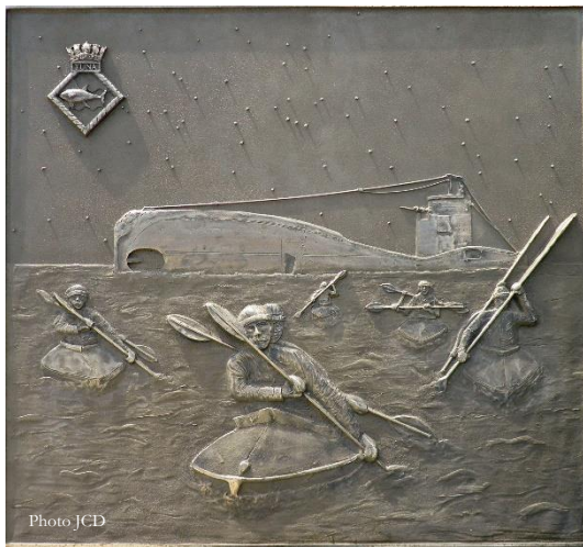
Kayaks et HMS Tuna (Mémorial, Le Verdon)

Sous l'autorité du Premier ministre, Winston CHURCHILL, Lord Louis MOUNTBATTEN est nommé commandant en chef des opérations combinées ( COHQ, Combined Operations Headquarters ). Le major HASLER est affecté au centre de développement des opérations combinées ( CODC ). Ce dernier va se battre pour faire triompher son projet : envoyer des commandos se déplaçant à bord de kayaks. Mission : détruire les navires forceurs de blocus dans le port de Bordeaux. Les kayaks remonteront la Gironde puis la Garonne après avoir été débarqués au large de Montalivet.